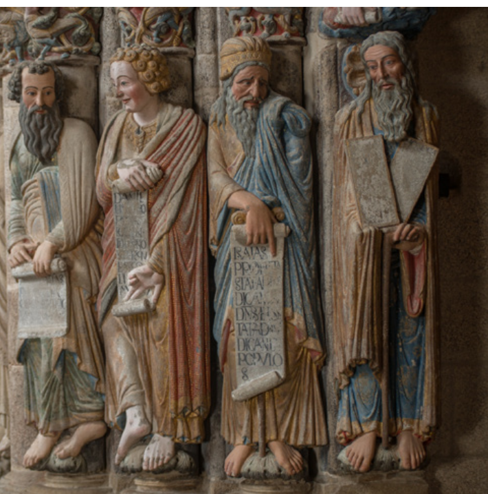
Programa Catedral-Fundación Barrié / Fundación Catedral de Santiago