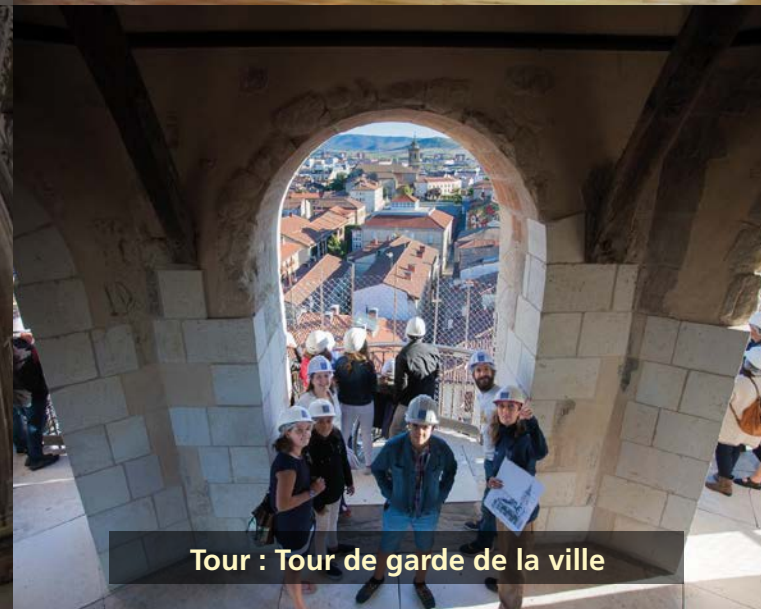
Tour : Tour de garde de la ville