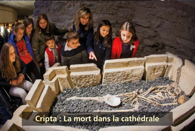
Cripta : La mort dans la cathédrale