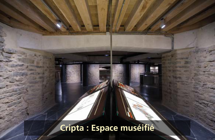
Cripta : Espace muséifié