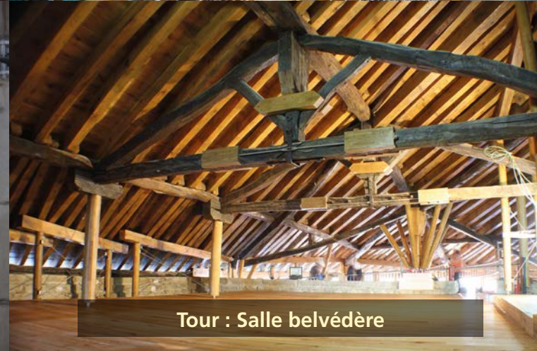
Tour : Salle belvédère