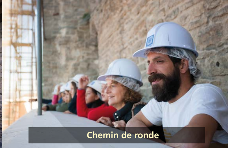
Chemin de ronde