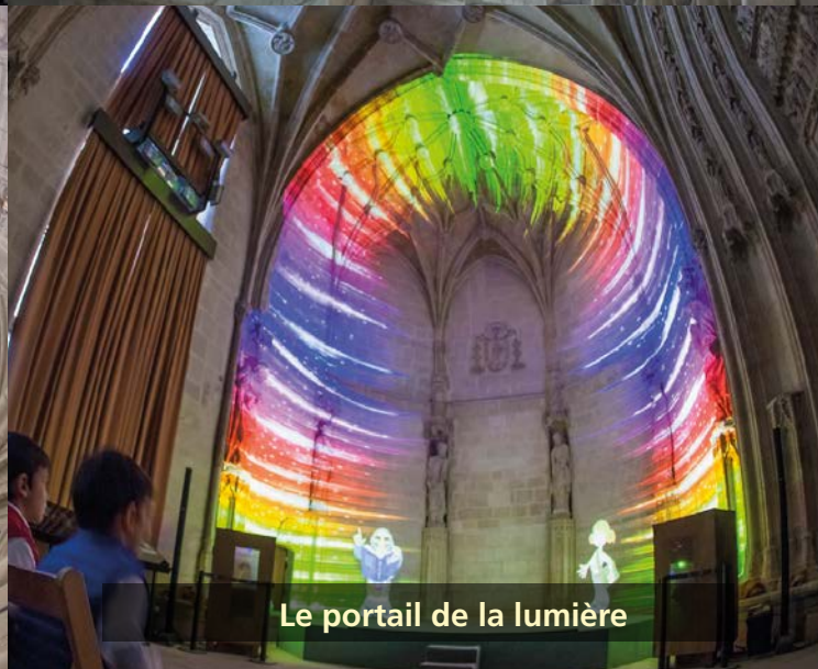
Le portail de la lumière