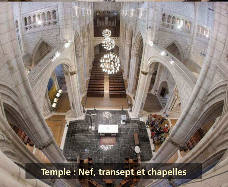
Temple : Nef, transept et chapelles