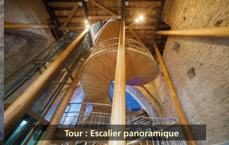
Tour : Escalier panoramique