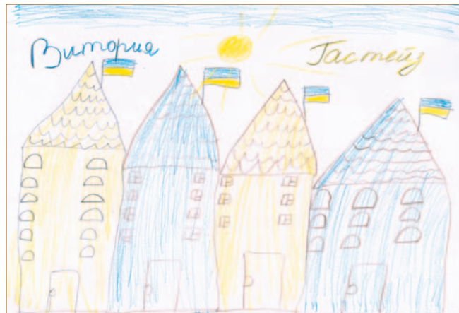
Dibujo realizado por uno de los niños ucranianos acogidos en el Albergue.

De hecho, el Albergue ha sido uno de los primeros recursos utilizados para dar cobijo a las familias ucranianas en Euskadi. En un principio la mayoría de ellas estaban en tránsito, permaneciendo solo unos días en el Albergue, a la espera de emprender viaje hacia otros lugares. Posteriormente se ha ido acogiendo también a personas refugiadas cuyo destino final es nuestra ciudad, las cuales han podido acceder desde un primer momento a recursos básicos como sanidad o edu-