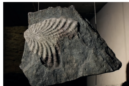
Inoceramus-aren erreprodukzioaren irudia, katedralerako bisita gidatuan ikus daitekeena.

sektuak gordetzen dituela Eraiki hau, altxor historikoa eta arkitektonikoa ez ezik, iragan geologikorako ataria ere bada.