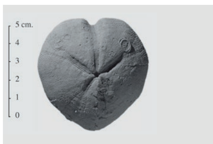
Itsas trikuen Micraster-aren eskala-adibidea

Absideen inguruan egindako indusketa- ren bidez, arkeologiak zein arkitektoak harrituta utzi zituzten ezusteko datuak eskuratu ziren. Zehazki, tamaina handi- ko fosil baten hondakinak aurkitu zituz- ten. Natur Zientzien Museoarekin kont- sultatu ondoren, Inoceramus bat bezala identifikatu zen, eta itsas trikuen aztar- nak ere aurkitu zituzten.