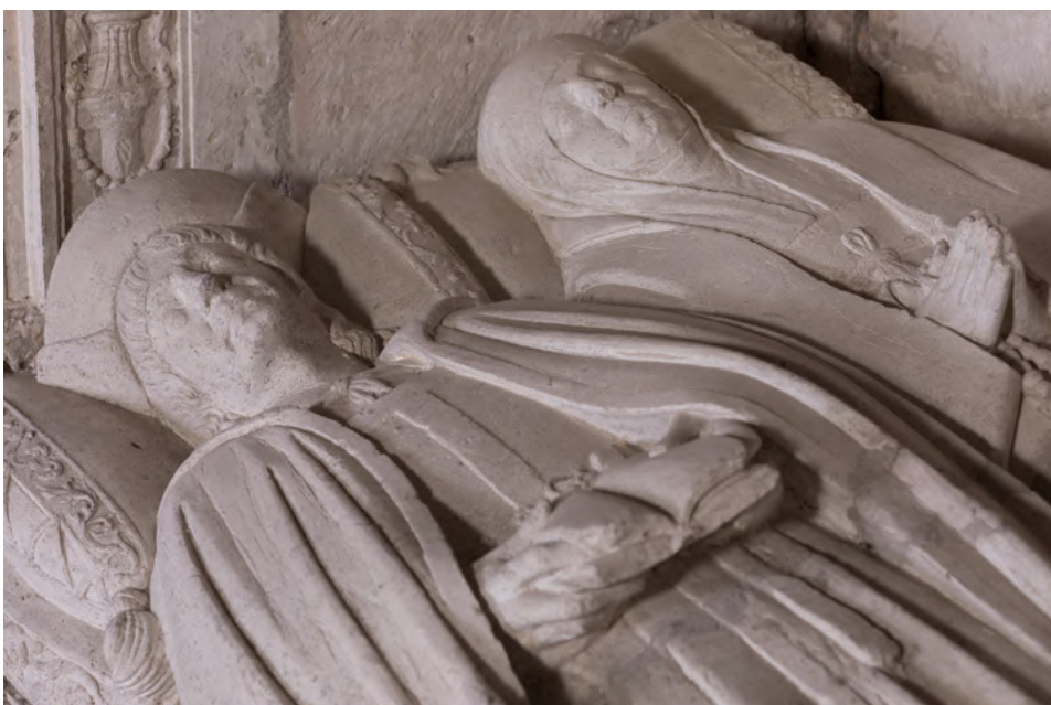
Detalle del sepulcro.

El sepulcro está decorado siguiendo los gustos del Primer Renacimiento y, aunque desconocemos la fecha de su construcción, sabemos que en 1521 aún no estaba edificado.